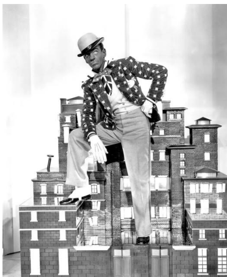
Figura 4 - Fred Astaire em blackface em seu solo “ Bojangles of Harlem ”, parte do filme “ Swing Time ” em 1936

O resultado do feito de Daddy Rice, foi este: