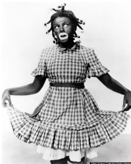
Figura 5 - Judy Garland em blackface como protagonista no filme “Diabinha de Saias”, em 1938.