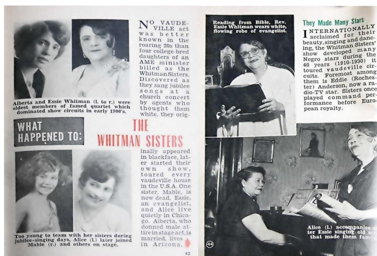
Figura 6 - Matéria na revista “Hue Magazine”, publicada em 30 de junho de