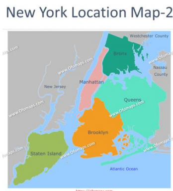
Figura 1 - Mapa da cidade de Nova York.