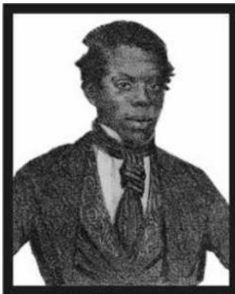
Figura 3 - Retrato de William Henry Lane “Master Juba”.