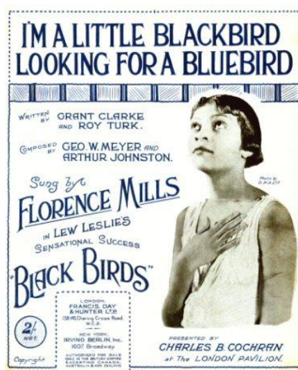
Figura 8 - Cartaz do musical Blackbirds de 1926, estrelando Florence Mills.