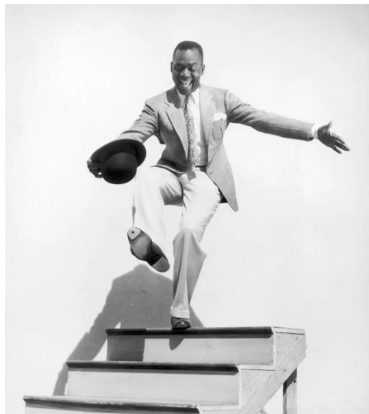
Figura 9 - Bill 'Bojangles' Robinson no filme Hooray for Love (1935).