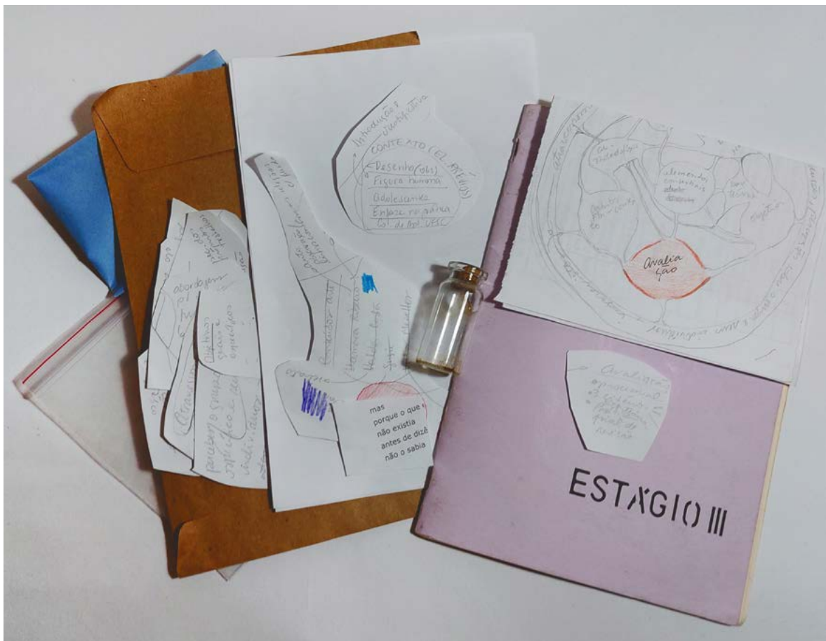
Figura 4. Coletas realizadas por estudante Luanda Rainho Ribeiro na disciplina de Estágio Curricular Supervisionado III. Arquivo pessoal, 2020.