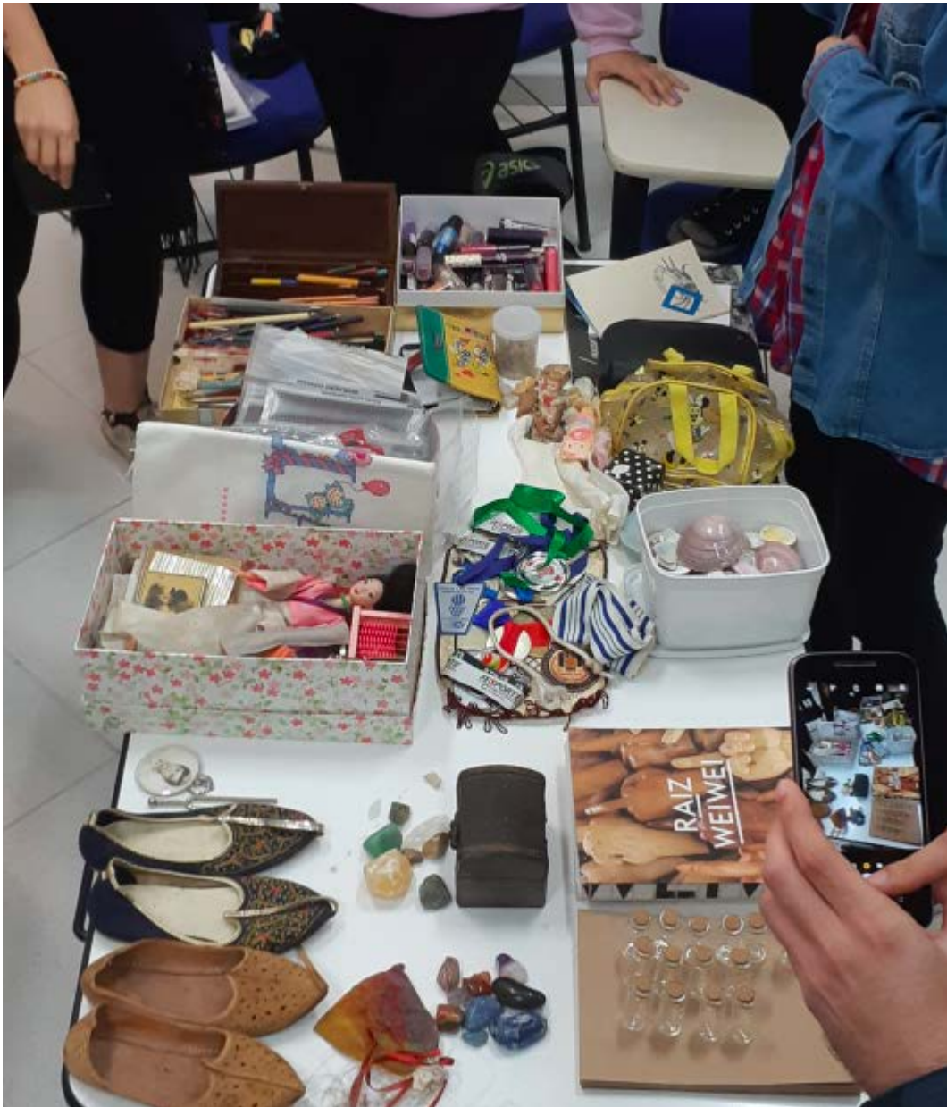
Figura 1. Mesa expondo os objetos guardados pelos estudantes da disciplina de Estágio Curricular Supervisionado III.