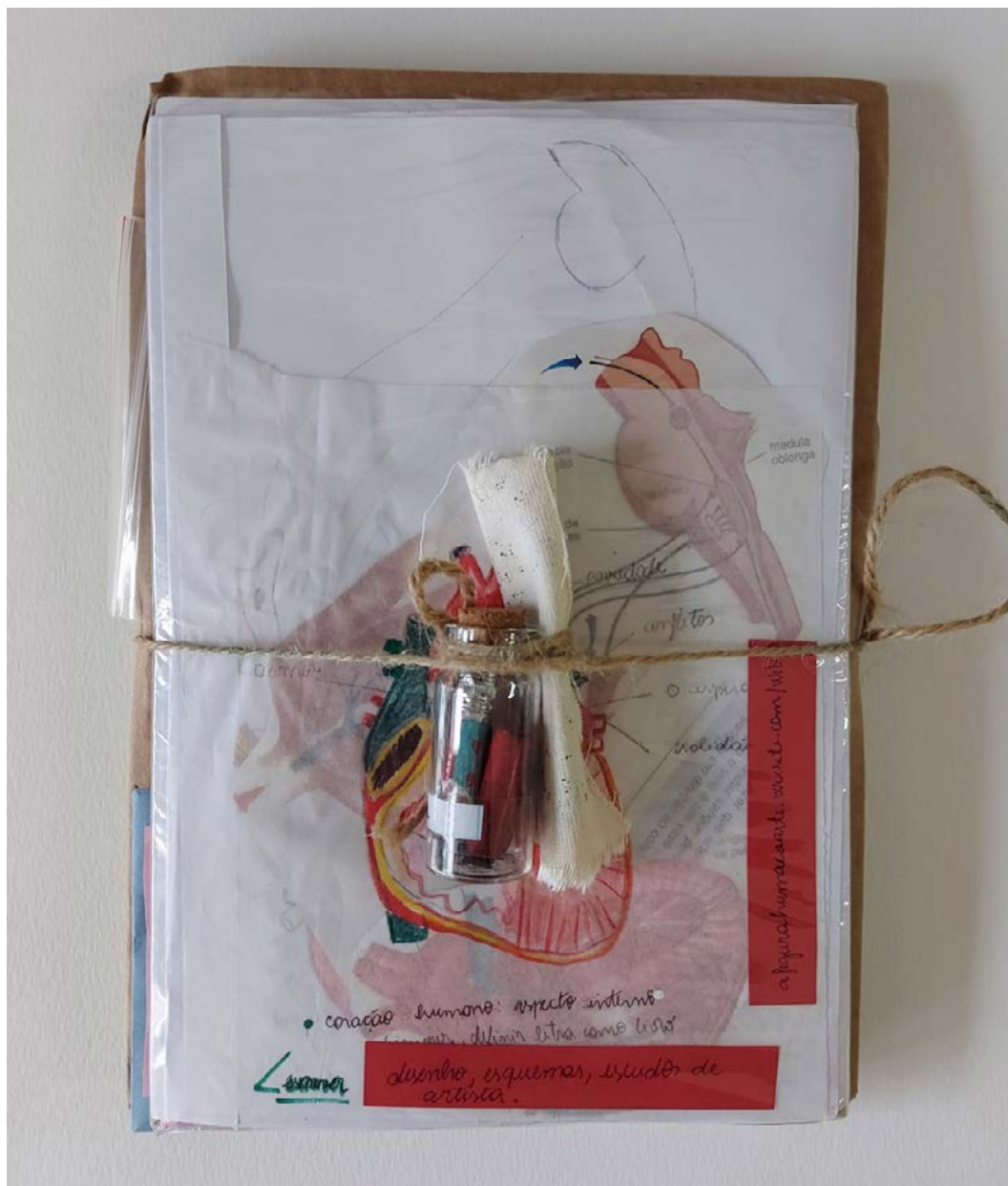
Figura 2. Coletas realizadas pela estudante Marina de Moraes dos Santos na disciplina de Estágio Curricular Supervisionado III.