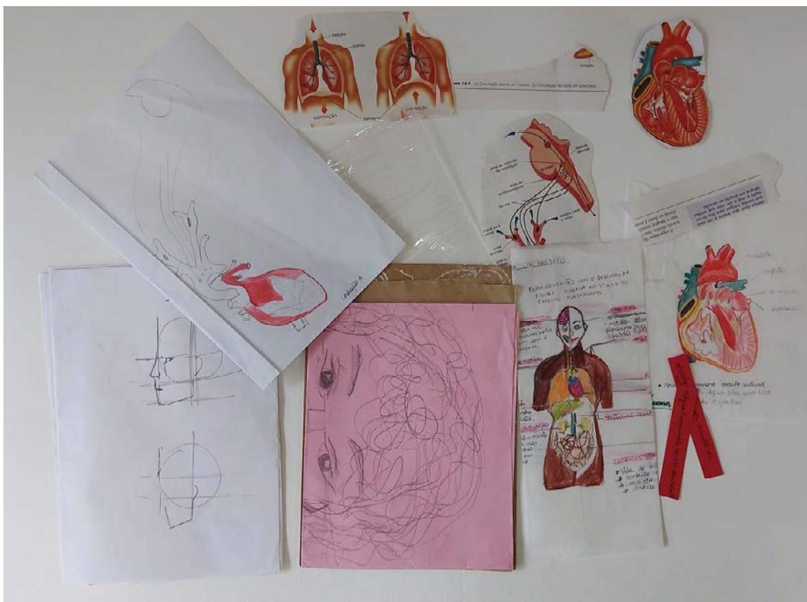
Figura 3. Coletas realizadas pela estudante Marina de Moraes dos Santos na disciplina de Estágio Curricular Supervisionado III. Arquivo pessoal, 2019.