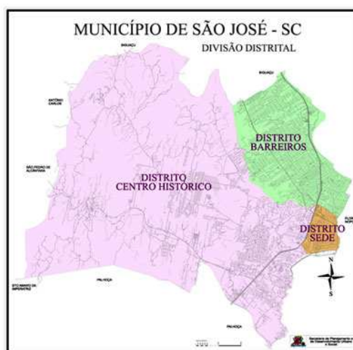
Figura 1 – Mapa Município de São José/SC

Este estudo teve como local de pesquisa uma escola de Educação Básica situada no distrito sede do Município de São José/SC, que pertence a mesorregião da Grande Florianópolis e a microrregião de Florianópolis, ficando apenas a 6 km da capital e localizado na parte central do litoral catarinense.