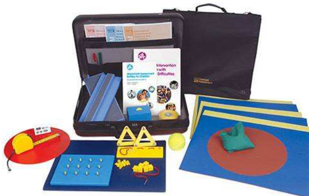
Figura 2 – Instrumento M-ABC2

O teste é administrado individualmente, e leva cerca de 20 a 40 minutos para ser realizado dependendo da idade e da dificuldade motora apresentada pela criança. O presente estudo utilizou as faixas 2 e 3.