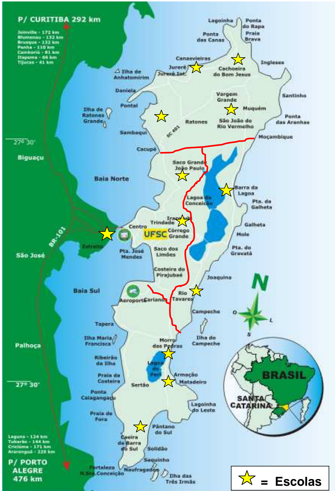
Figura 2. Mapa de Florianópolis – SC dividido por regiões.